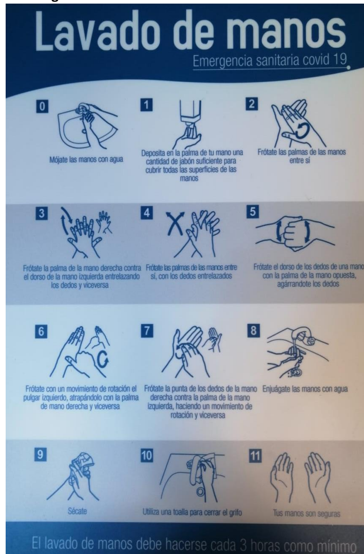
Imagen 3. Protocolo lavado de manos – señalización