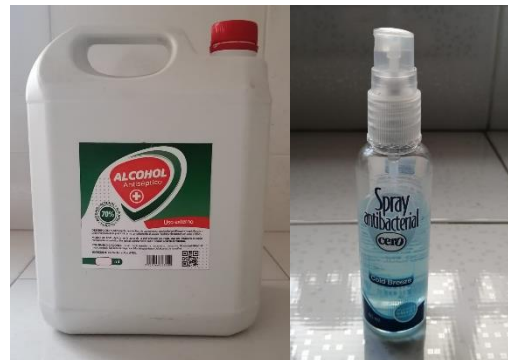
Imagen 5. Alcohol al 70%

Descripción: se ubican frascos tipo spray en áreas como sala de profesores, áreas administrativas, cafetería, ingresos. Cada docente tiene un kit que incluye spray de alcohol.