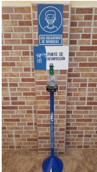
Imagen 4. Dispensadores de Gel Antibacterial

Descripción: Los puntos de desinfección dispuestos se encuentran en todas las áreas comunes y están compuestos por: Soporte de pedal para facilitar el acceso y disponibilidad del elemento, Frasco transparente para tener visibilidad de la cantidad y calidad de su contenido y Gel Antibacterial disponible durante toda la jornada para su uso.