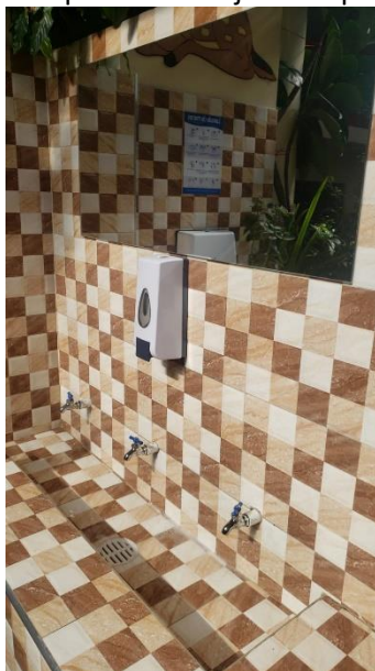
Imagen 1. Dispensador de jabón líquido